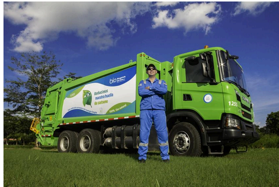
Ilustración 1. Vehículo recolector de residuos ordinarios.