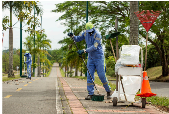
Ilustración 2. Actividad de Barrido y Limpieza

Actualmente se presta el servicio de Barrido con la cobertura de vías y áreas públicas según lo definido en el documento técnico del PGIRS. Bioagrícola del Llano S.A. E.S.P. BIC se encuentra en constante actualización de las nuevas urbanizaciones y localidades con el fin de mantener o incrementar dicha cobertura. Para surtir dicho proceso, se deberá tener en cuenta lo contemplado en el Documento Técnico del PGIRS, en su numeral 3.1.3.3. “Lineamientos para la prestación del servicio de barrido y limpieza de vías y áreas públicas”. Por consiguiente, de requerirse algún ajuste para la prestación de este servicio en el municipio, deberá ser revisado y autorizado por el grupo coordinador del PGIRS para ser adoptado por la administración municipal: