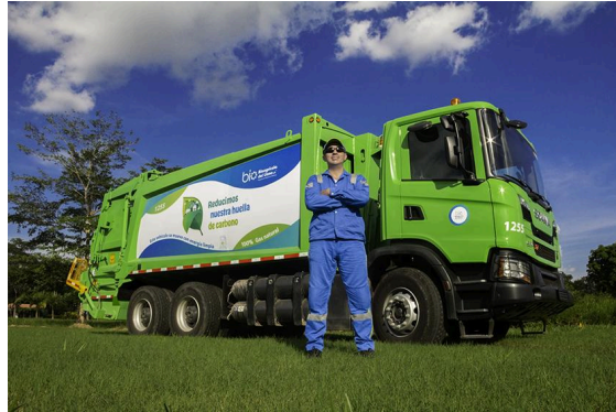
Ilustración 1. Vehículo recolector de residuos ordinarios.

cúbicas se tiene un vehículo tipo Ampliroll. Adicionalmente, 16 2 de nuestros vehículos cuentan con sistema de izaje Lifter para contenedores plásticos de hasta 1100 Litros.